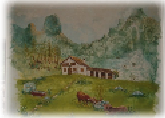
L'affresco che raffigura la malga realizzato su uno dei muri interni.

Percorrendo la strada che porta al santuario Madonna del Lares, imboccando poi la strada forestale che risale la Val di Bolbeno (Val Larga), percorribile in auto fino a Malga Splaz (previo autorizzazione), dopo un'oretta circa di cammino si raggiunge la bella Malga Meda (1656 mslm).