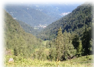
Val larga, da in cima alla "rampa finale"

È da questa data che risalgono le informazioni a noi disponibili. Collocata originariamente 100 metri di dislivello più a valle, alla base di un pendio detto "rampa finale", Malga Meda fu costruita nell'attuale posizione solamente nell'anno 1913. Non indifferenti furono le difficoltà da affrontare per la difficile accessibilità del luogo, quindi si pensò di costruire una " calchera " allo scopo di avere a disposizione la calce direttamente sul posto; si trattava di una vera e propria "macchina" produci-calce costituita da una profonda costruzione in sassi cilindrica, con una bocca di accesso nella parte inferiore necessaria per l'accensione del fuoco. Infatti, al di sopra di essa, si trovava una "volta a botte" la quale, diventando ardente, "cuoceva" le pietre inserite nel cilindro. Queste dopo una settimana di cottura, poste a contatto con acqua fredda, si "tramutavano"