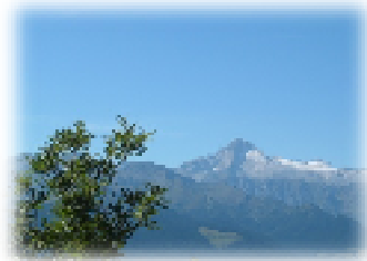
Il Caré Alto visto da Malga Meda

Il panorama circostante include delle accattivanti cime, tra queste il monte Altissimo (Altisém, 2135 mslm) e la cima Pala, 2000 mslm, raggiungibili con escursioni di media difficoltà. Dalla cima del monte Altissimo si apre un panorama mozzafiato che va, nelle giornate più limpide, dalla parte più a sud del Lago di Garda sino alle alpi Austriache e Svizzere con pieno sbocco a Nord su Adamello, Presanella e Brenta.