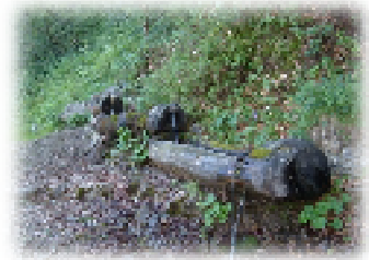
I "brenc", unica font d'acqua vicina alla malga. (nelle estati poco piovose non scorre acqua)