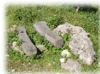
Il sasso di metà valle

Erano ormai diversi anni che la Malga non era più utilizzata per l'alpeggio e gli unici fruitori erano o passanti o cacciatori che vi passavano la notte in attesa dell'uscita del giorno dopo. È in questo contesto che si sentiva sempre più l'esigenza di un deciso intervento di ripristino. Nasce così, dalla geniale idea di un gruppo di volontari di Bolbeno, l'ormai celebre Comitato Malga Meda, che si ripropose di rimettere a nuovo tutta la Malga e lo stallone ad essa collegato.